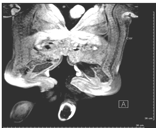
شکل ۱- MRI دوقلوهای به هم چسبیده قبل از عمل

در سونوگرافی شکم اشتراک و چسبندگی قسمتی از کبد آنها دیده شد، ولی سیستم صفراوی آنها مستقل بود. MRI قبل از عمل جراحی نیز گویای اشتراک قسمتی از کبد آنها بود (شکل شماره ۱).