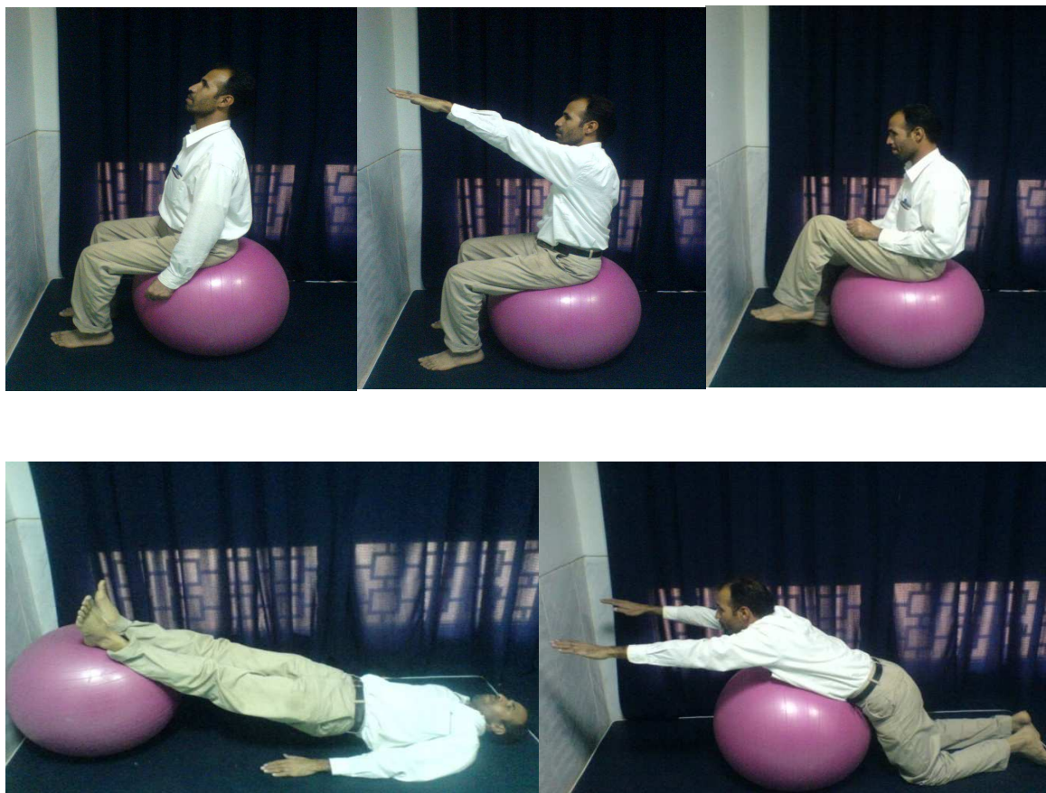
شکل ۱: تمرینات ثبات‌دهنده

جابه‌جایی کنترل‌شده‌ی وزن را در صفحه‌ی فرونتال ارزیابی می‌کند (۶). بیمار با چشمان باز پشت به دیوار ایستاده، درحالی که پاها به اندازه‌ی عرض شانه‌ها باز بودند. شانه‌ها در ۹۰ درجه‌ی ابداکسیون (دور شدن) و آرنج و انگشتان در حالت کشیده بودند. فرد شانه و تنه را به صورت واحد تا جایی که تعادلش به هم نخورد، یکبار به سمت راست و بار دیگر به سمت چپ جابه‌جا می‌کرد. اگر فرد قدم برمی‌داشت یا به جلو پرت می‌شد و یا کنترل حرکت را از دست می‌داد، آزمون پایان یافته بود. آزمونگر فاصله‌ی بین نوک انگشتان در زمان شروع حرکت و در زمان پایان تست را اندازه می‌گرفت و به عنوان نمره‌ی آزمون ثبت می‌کرد. این آزمون‌ها یکبار قبل از انجام برنامه‌های تمرین درمانی و یکبار پس از آن، برای تمامی بیماران شرکت‌کننده در هر دو گروه، صورت پذیرفت.