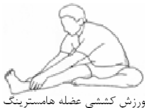
ورزش کششی عضله هامسترینگ