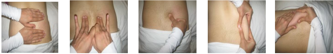
تصویر ۱- انواع روش‌های ماساژ به ترتیب از چپ به راست: استروکینگ عمقی، پولینگ، فریکشن، رولینگ و رینگینگ

دستگاه ۲۰ دقیقه و به صورت یک کاناله بود و دو الکتروود در دو طرف ستون فقرات به روی عضلات پاراورتبرال قرار می‌گرفت). پس از جمع‌آوری اطلاعات، داده‌ها وارد برنامه SPSS شد و با استفاده از روش‌های آماری تی زوجی و تی مستقل، تجزیه و تحلیل شد.