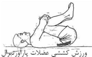
ورزش کششی عضلات پاراورتبرال