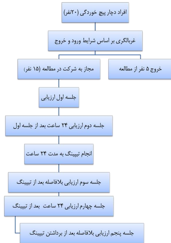
شکل ۱: فلوچارت مطالعه

و اندازه‌گیری نوسانات مرکز فشار در وضعیت‌های بدون اغتشاش، اغتشاش قدامی خلفی و اغتشاش طرفی شرکت کند. جهت جلوگیری از اثر یادگیری، ترتیب انجام این وضعیت‌ها به طور تصادفی و با انتخاب یکی از ۶ کاردتی که شامل ترکیب‌های مختلف این ۳ آزمون بود توسط فرد مورد آزمون مشخص می‌شد. جلسات ارزیابی شامل: جلسه اول ارزیابی در روز اول مراجعه، جلسه دوم ارزیابی در روز دوم قبل از انجام KT، جلسه سوم ارزیابی در روز دوم بلافاصله بعد از انجام KT، جلسه چهارم ارزیابی در روز سوم تست (۲۴ ساعت بعد از نصب KT) و جلسه پنجم نیز در روز سوم تست و بلافاصله بعد از برداشتن KT انجام شد (شکل ۱).