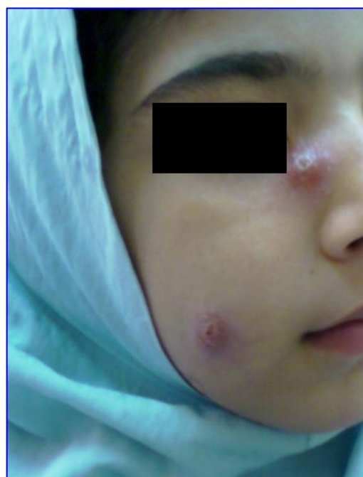
شکل ۱. بیمار مبتلا به زخم فعال سالک

۲٪ از افراد مورد مطالعه (۱۰۳ نفر) دارای زخم فعال سالک بودند. از ۲۰۰ مرد مبتلا به سالک ۵۳ نفر (۲۶/۵٪) و از ۱۲۶ زن مبتلا به سالک ۵۰ نفر (۳۹/۷٪) مبتلا به زخم