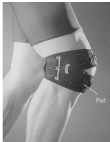
شکل ۱. بريس حمايت‌کننده کشکک و محل قرارگيري پد

زانو هر فرد انتخاب می‌شد تا محدودیتی را در حرکت فرد ایجاد نکند.