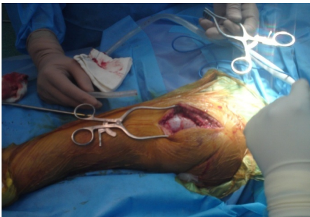
شکل ۵. اپروچ کوخر برای ریداکشن هیپ و ساتروک بیمار در اتاق عمل جراحی دو روز بعد از حادثه