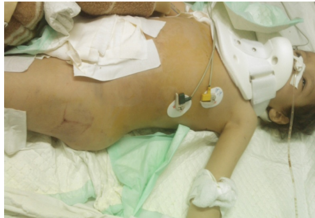
شکل ۱. تصویر بیمار ۴ ساله با شواهد آسیب متعدد در زمان پذیرش که در بخش ICU بستری بوده است