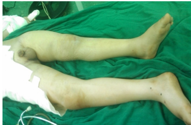
شکل ۲. تصویر اندام های تحتانی بیمار با حدود هشت سانتیمتر کوتاهی و چرخش خارجی اندام در سمت چپ در روز پذیرش