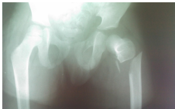
شکل ۳. رادیوگرافی لگن بیمار در نمای روبه رو قبل از عمل جراحی. شکستگی ساتروکانتریک با کامیوشن مدیال و دررفتگی خلفی هیپ مشهود است