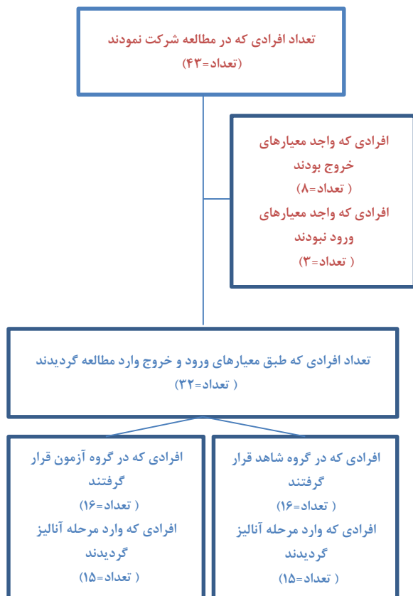
شکل ۱. نحوه ورود بیماران به مطالعه

اپورث از صفر (عدم خواب‌آلودگی در هیچ وضعیتی) تا ۲۴ (احتمال زیاد خواب‌آلودگی در تمام ۸ وضعیت) تعیین شده است. نمره نهایی مقیاس اپورث در محدوده صفر الی ۸ نشان‌دهنده وضعیت خواب‌آلودگی طبیعی، محدوده ۹ - ۱۲ نشان‌دهنده وضعیت خواب‌آلودگی خفیف، محدوده ۱۳ - ۱۶ نشان‌دهنده وضعیت خواب‌آلودگی متوسط و امتیاز بیش‌تر از ۱۶ نشان‌دهنده خواب‌آلودگی شدید می‌باشد. از لحاظ بالینی مقیاس خواب‌آلودگی اپورث بیش‌تر از ۱۰ مهم تلقی شده و نشان‌دهنده خواب‌آلودگی می‌باشد [۲۹].